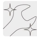
Pulido espejo para fácil limpieza