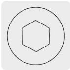
Entrada para llave allen