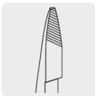
Mordazas con moleteado diagonal