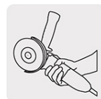
Mayor ergonomía y confort