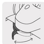
Guarda de ajuste rápido